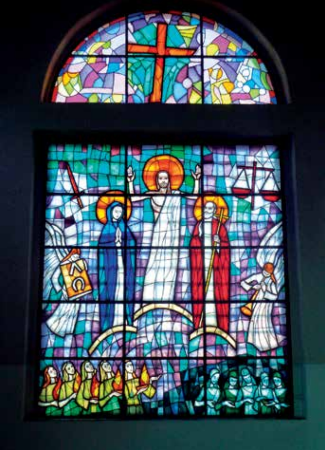
Vlatko Blažanović, Uskrsnuće (župna crkva u Čukliću kod Livna)

nisu uskrsnuli, nego je njih Isus – snagom svoje božanske moći – povratio iz smrti u život. Oni, jedanput od Isusa oživljeni, ponovno su morali umrijeti. Vraćeni su iz smrti u ovaj zemaljski život podložan patnji i umiranju i nisu, kao Isus, prešli u drugi, novi život kod Boga, odakle je – kao Bog – i došao.