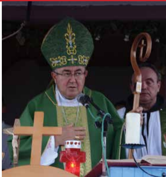
Kardinal Vinko Puljić na misi u Turiću

Danas slavimo slugu Božjega fra Lovru Milanovića, koji je bio spreman na žrtvu. Nema boljega lijeka da izliječi to naše zatrovano ozračje od spremnosti na žrtvu. On je bio spreman