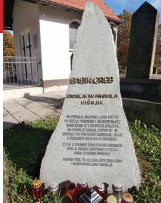
Babin greb u Višnjiku

u župi sv. Franje Asiškog Žeravac. Ta kosa vodi od doma mjesne zajednice i filijalne crkve u Višnjiku strmu prema župi Bukovica, koja se uzdiže na susjednom brdu. I danas u njoj ima Guberaca, ali ih je znatno više u drugim dijelovima sela Donji i Gornji Višnjik.