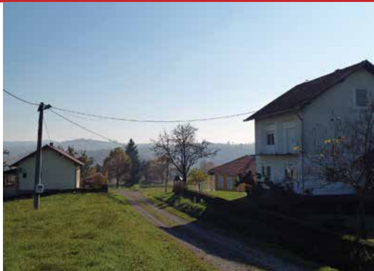
Peratovci - glavni put kroz zaseok