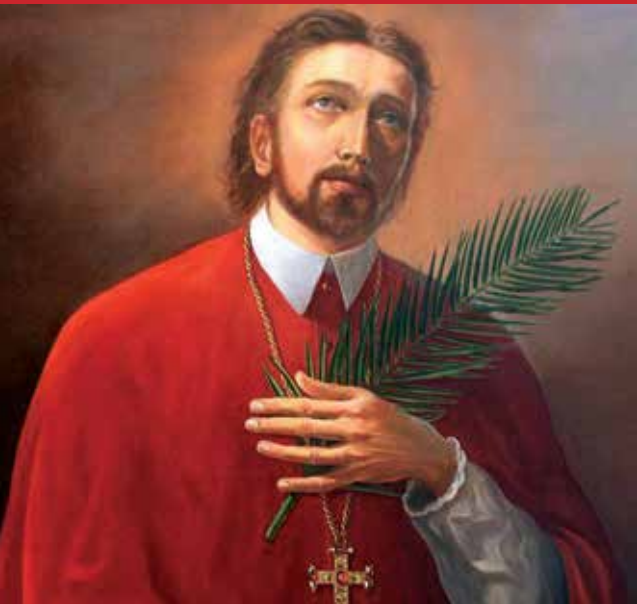
Sveti Marko Križevčanin