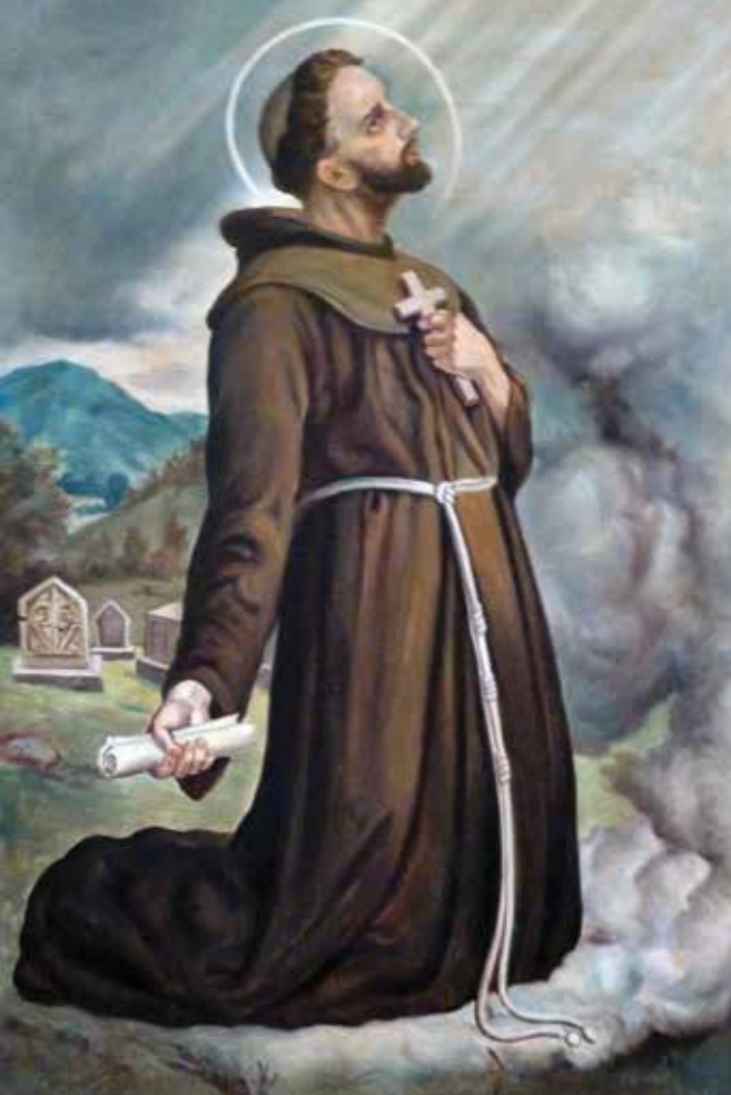
Gabriel Jurkić, Fra Nikola Tavelić, prvi hrvatski svetac

Svetome pismu, ima povlašten položaj i pruža izvornije polazište za razumijevanje cjeline.