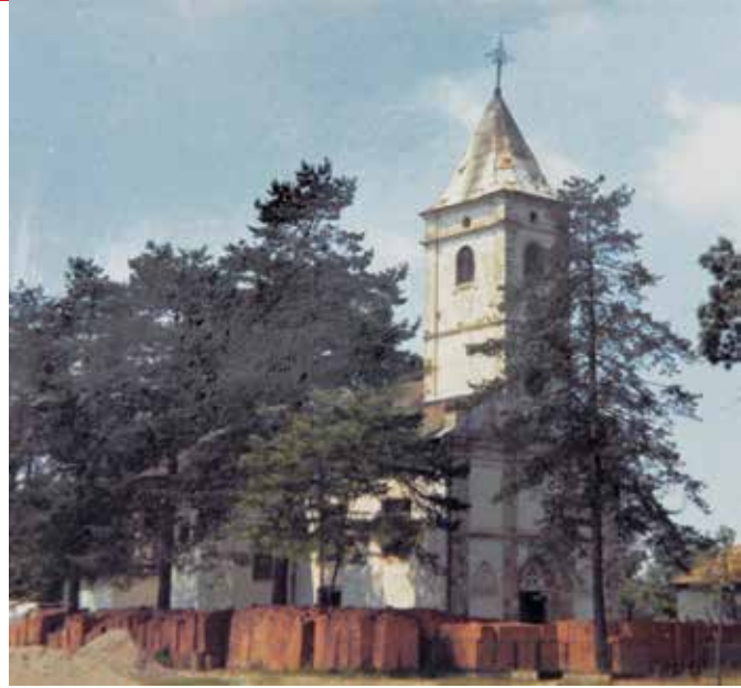
Stara župna crkva

U Tramošnici je krstio još dvoje djece i to 11. prosinca 1806. (br. 133. ) i na sam Božić 25. prosinca 1806. (br. 139.). Sljedeće pak 1807. godine krstio je djecu u Turiću 11. siječnja (br. 142.), 23. siječnja (br. 176.) i 26. siječnja (br. 177.), a 27. siječnja (178.) u Orlovu Polju. U Slatini je 30. siječnja krstio troje djece upisane pod brojevima 179, 180 i 181, a onda opet u Tramošnici 2. veljače dijete upisano pod brojem 184.