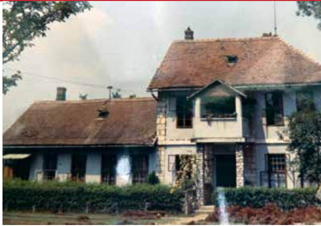
Stari župni stan

godine i da je tada imala 6.301 vjernika te da je pripadala modričkom samostanu.