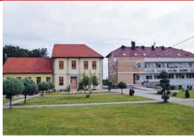
Obnovljena stara župna kuća (lijevo) i samostan sestara franjevki u Gornjoj Tramošnici

Slabljenjem turske moći neki katolici se vraćaju na ova područja te Izvještaj kanonske vizitacije iz 1768. godine bilježi da Tramošnica tada ima 36 obitelji (146 odraslih i 92