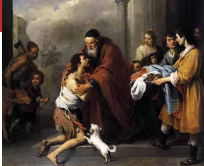
Bartolome Estéban Murillo, Povratak izgubljenog sina

Isus nije samo navijestao poruku o Božjem milosrđu nego ga je i sam ostvarivao, živio: ono što je govorio, to je i živio. Svoju je pak poruku o Božjem milosrđu Isus možda